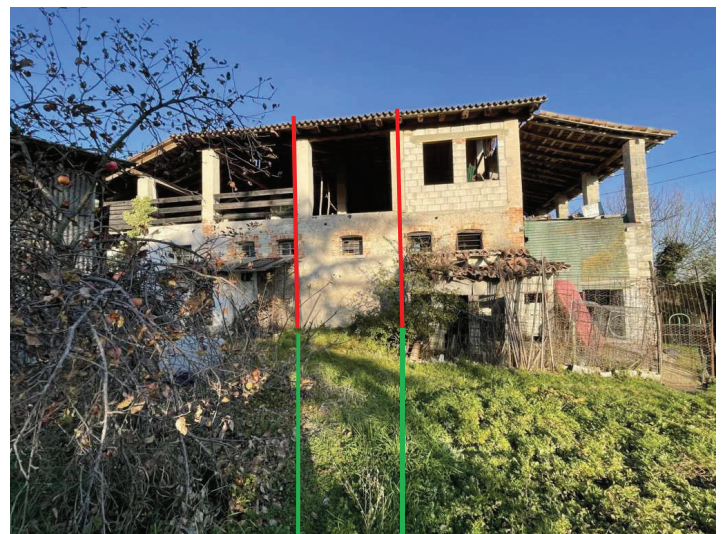
foto n. 6 – prospetto ovest della porzione terra-cielo con antistante fascia di terreno