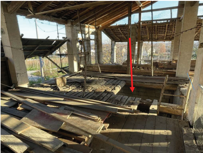
foto n. 15 – vista dal prospetto N del piano piano della parte di P1 sopra locale di accesso