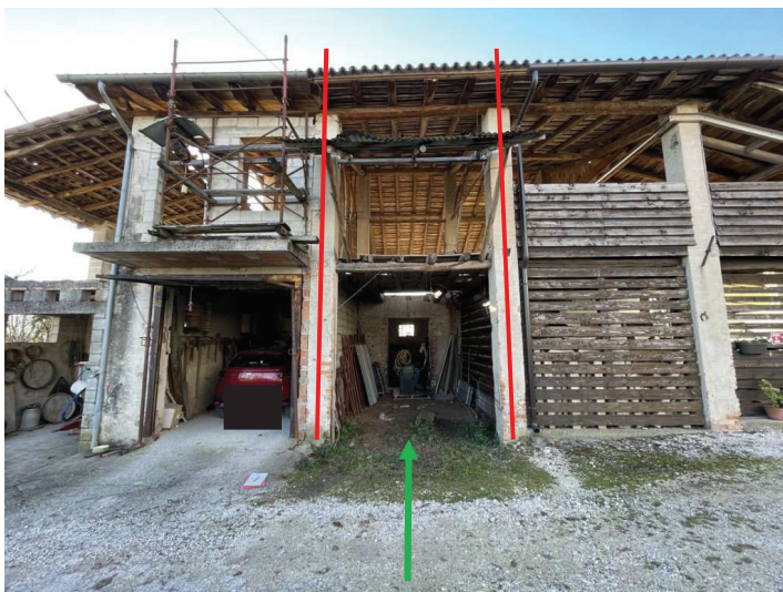
foto n. 5 – prospetto est della porzione terra-cielo con antistante fascia di terreno