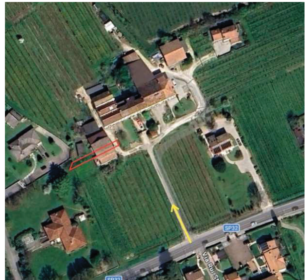
foto n. 2 – individuazione lotto e della stradina di accesso su Google Maps