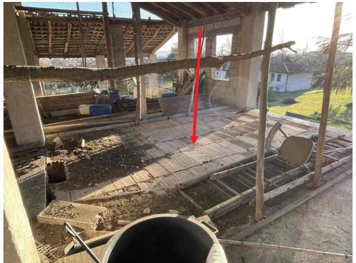
foto n. 16 – vista dal prospetto N del piano piano della parte del P1 sopra secondo locale