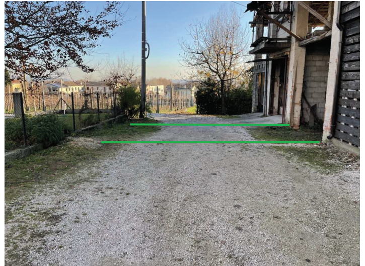
foto n. 4 – area scoperta est che consente accesso alla porzione pignorata e a proprietà di terzi